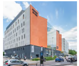
Lyon - Clinique du Parc

AEW reste confiante dans les perspectives du marché immobilier de santé et poursuit ses efforts d'identification d'actifs pour le compte de votre SCPI, afin de constituer un portefeuille cohérent et résilient tourné vers les besoins actuels et futurs du public.