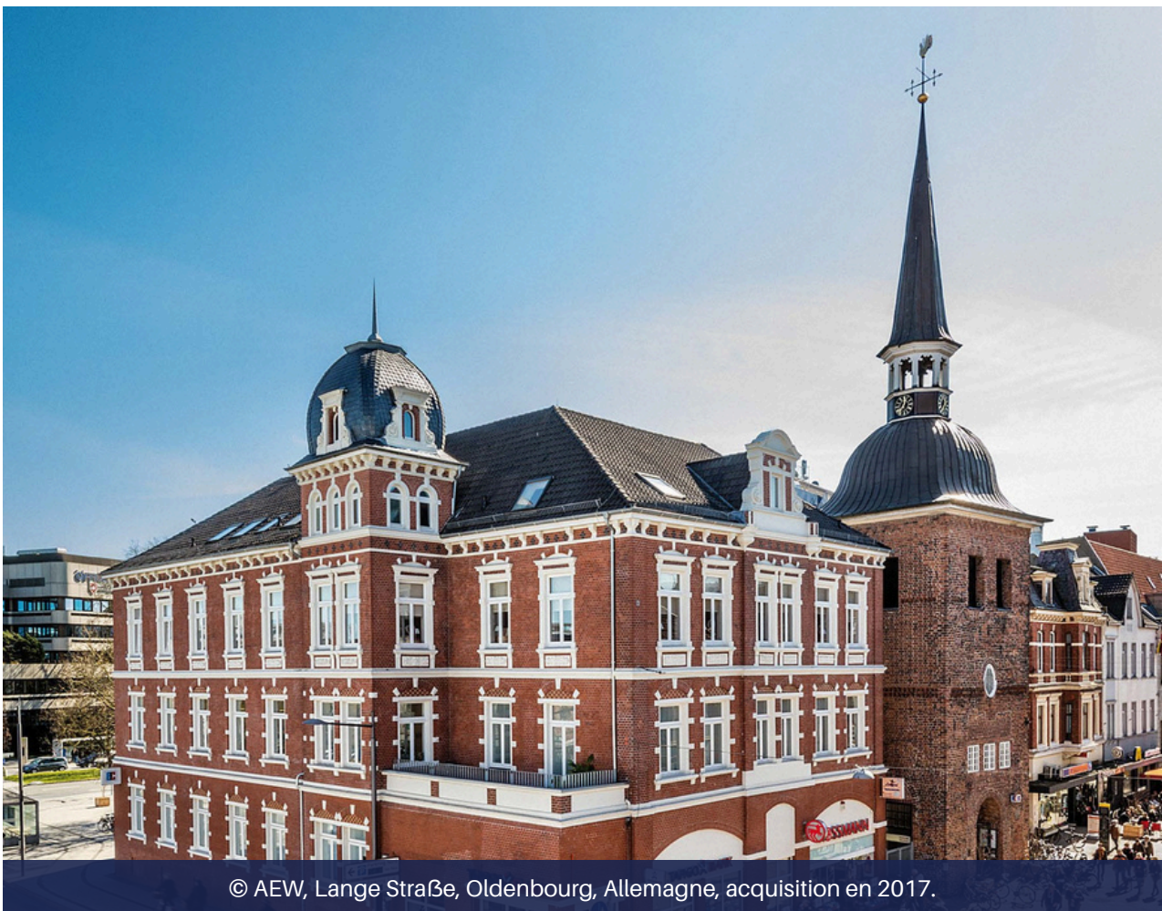
© AEW, Lange Straße, Oldenburg, Allemagne, acquisition en 2017.

Céder ses parts en réaction à une baisse de la valeur de l'immobilier conjoncturelle revient à cristalliser une éventuelle perte en capital et se priver de futurs revenus potentiels. En effet, la baisse de la valeur de l'immobilier n'a pas d'impact sur le montant des loyers qui, par ailleurs, sont indexés sur l'inflation.