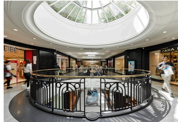
Passy Plaza, Paris (75), Atout Pierre Diversification, acquisition en 2023.

Pour AEW Diversification Allemagne , lors de l'Assemblée Générale Extraordinaire de juin 2024, nous avons explicité le champ des typologies d'actifs possibles à l'investissement en précisant l'intégration possible des locaux logistiques ou en lien avec le secteur de la santé. À terme, cela pourrait permettre à cette SCPI d'améliorer la diversification des risques patrimoniaux et locatifs.