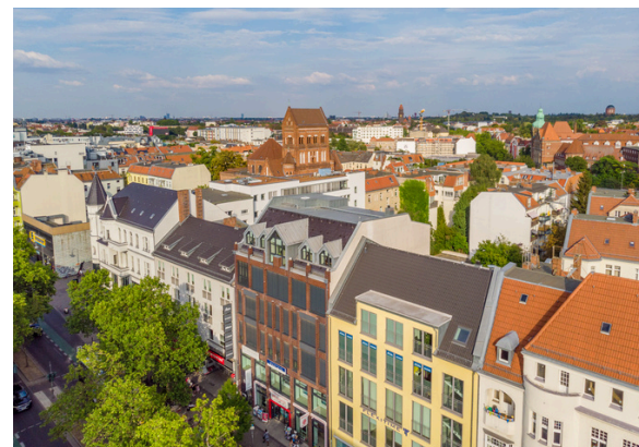
© Holger Peters, AEW Diversification Allemagne, Berlin, acquisition 2023.