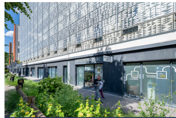
Clinique du Parc, Lyon (69), acquisition en 2024.