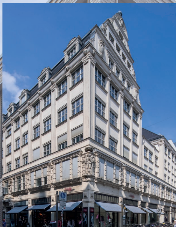
BUREAUX ET COMMERCE - Leipzig / Allemagne