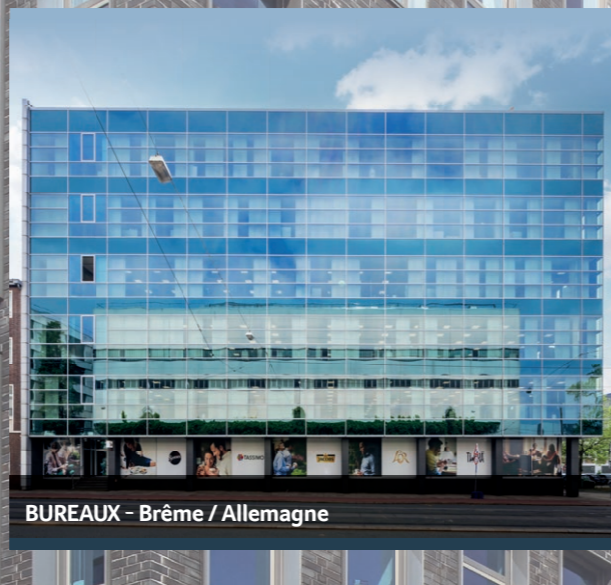
BUREAUX - Brême / Allemagne