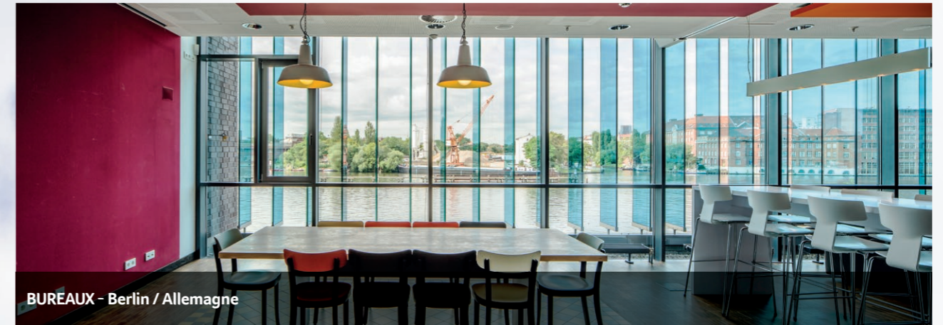
BUREAUX - Berlin / Allemagne

Le régime dépend de la situation personnelle de chaque associé et est susceptible d'évoluer dans le temps, il est donc recommandé aux associés de se rapprocher de leur conseiller fiscal habituel pour toute question.