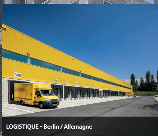
LOGISTIQUE - Berlin / Allemagne