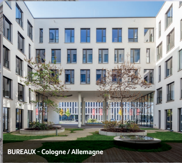
BUREAUX - Cologne / Allemagne

Les revenus fonciers de source allemande imposables en France et donnant lieu à crédit d'impôt sont déterminés selon les mêmes règles que les revenus fonciers de source française. A ce titre, l'impôt allemand n'est pas déductible du revenu imposable en France.