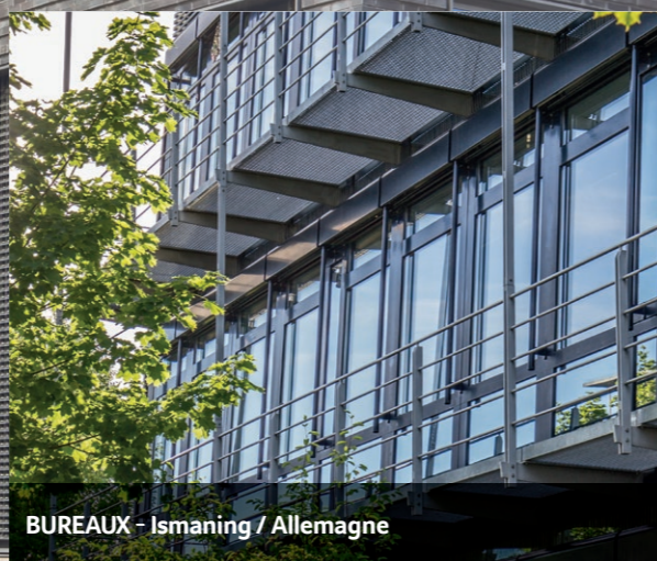
BUREAUX - Ismaning / Allemagne